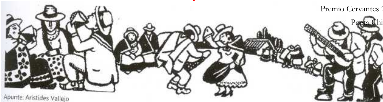
Apunte: Aristides Vallejo

Ahora, compatriotas, pobladores continentales, hombres de América, hermanos míos : levantemos su nombre con nuestras pobres vidas sin sosiego, coloquemoslo al borde de los sueños terrenales, cerca de la lágrima, por encima del grito, exactamente donde comienza el día, para que alumbré como el sol que lo queremos, para que sea la primera palabra buena que duerma y que sonría en el convulcionado corazón de los hambrientos. Luego, camaradas universales, marchemos junto a él, poderosos y altivos, deshojemos nuestro cariño en el claro sendero que trazó su mirada y que conduce a la fogata que se levanta en el corazón volcánico de los obreros. y escuchemos su voz. Esa voz donde transitan todas las pesadumbres del hombre, donde se timbran los metales de la nueva mañana que aman nuestros pueblos.