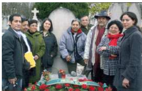
Romería en la tumba de Cesar Vallejo. En la foto directivo del Instituto de Estudios Vallejanos. Paris 2006.

El homenaje al poeta continuó con una reunión en la tarde en donde se combinó el interés por la vida y obra de Vallejo con la situación socio-económica del Perú. El profesor Suárez dictó una amena charla sobre la economía peruana. Todo esto acompañado, claro está, por una agradable tertulia alrededor de la degustación de algunas comidas tradicionales, preparadas por miembros del Instituto Vallejiano.